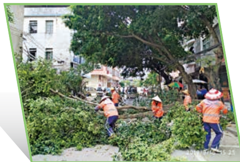
帮助吴圩镇修剪树木