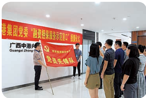
“融资担保服务示范窗口”全体成员进行服务宣誓

9月20日下午，绿港集团党委在中港兴公司开展“融资担保服务示范窗口”授旗活动，集团党委书记、董