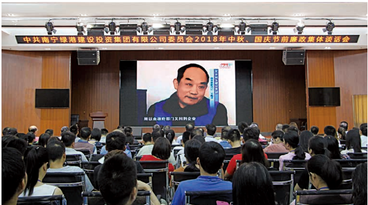
集团全体干部职工观看廉政警示教育片