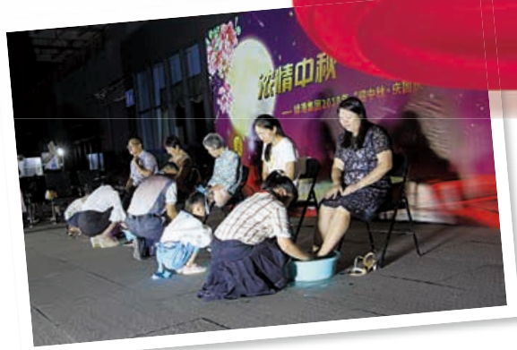
为父母浴足活动现场

以来，集团工会开展了以“比技能、比贡献、出成果、见成效”为主题的劳动竞赛，今年共有140余人参加了5个项目的角逐。通过竞赛活动的开展，进一步检验了职工队伍的素质，为企业健康发展奠定了良好的基础。