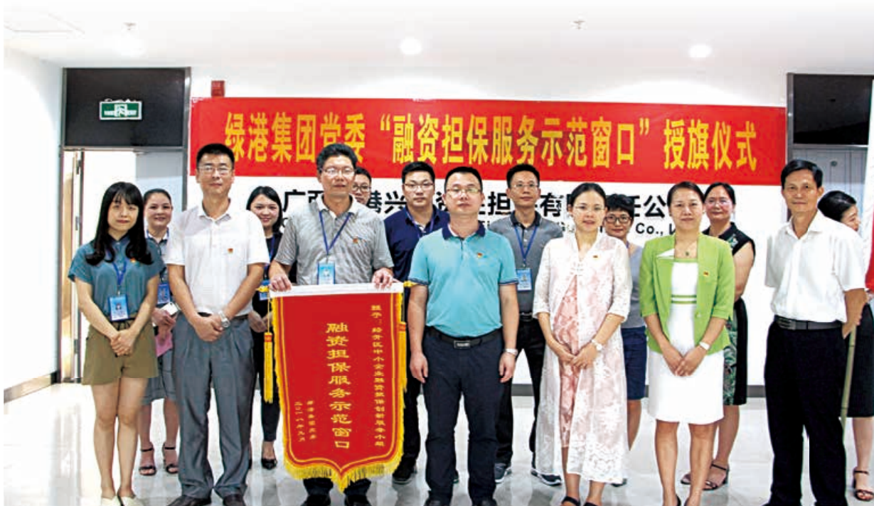
集团领导与“融资担保服务示范窗口”全体成员合影